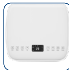
Pannello comandi touch con display a LED Touch control panel with LED display