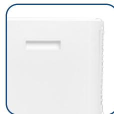
Pratiche maniglie laterali Useful side handles