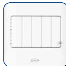
Alette verticali regolabili Adjustable vertical air louvers